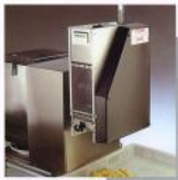
Gruppo gnocchi automatico