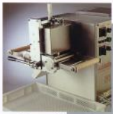
Gruppo ravioli automatico